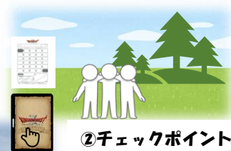
②チェックポイント (CP) で タブレットを使い写真撮 影して得点シートにCP番 号を記入して得点ゲット！