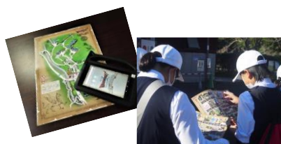
①ゲームの説明と 作戦タイム