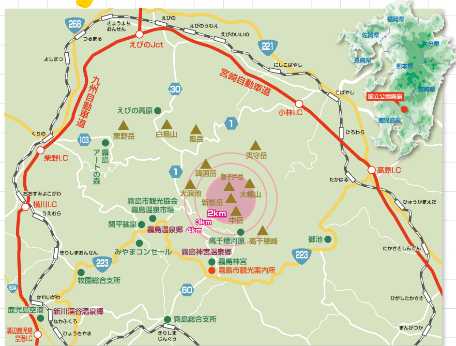
H24.9現在 新燃岳火口周辺は噴火警戒レベル3で半径2km以内は入山規制中です