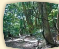
【森林セラピー丸尾自然探勝路】