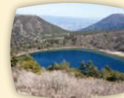
【甑岳(右)・六観音御池(中央)・夷守岳(右)】