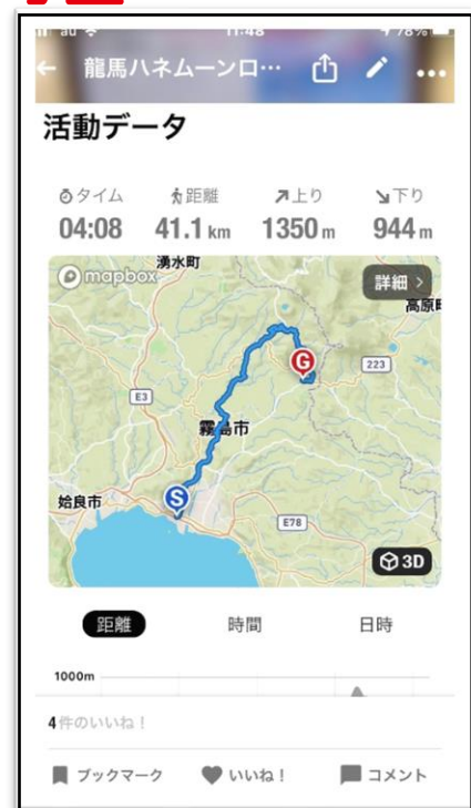
👉YAMAP アプリ活動データ