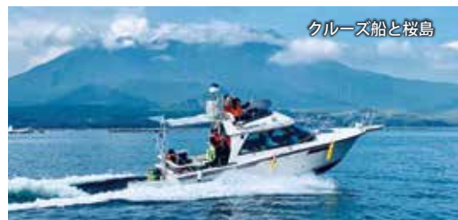
クルーズ船と桜島

※ 隼人新港 → JR 隼人駅 (タクシーで 10 分) ※ JR 隼人駅 → JR 鹿児島駅 (「特急きりしま」で約 30 分) ※ JR 鹿児島駅 → 本港区 (徒歩 10 分) ☆ 隼人新港でタクシーのご依頼がある場合は、ご予約時にお申し出ください。